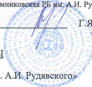
ГРАФИК ВЫЕЗДНОЙ РАБОТЫ на апрель 2022 года.

ГБУЗ Республики Мордовия «Темниковская РБ им. А.И. Рудявского»